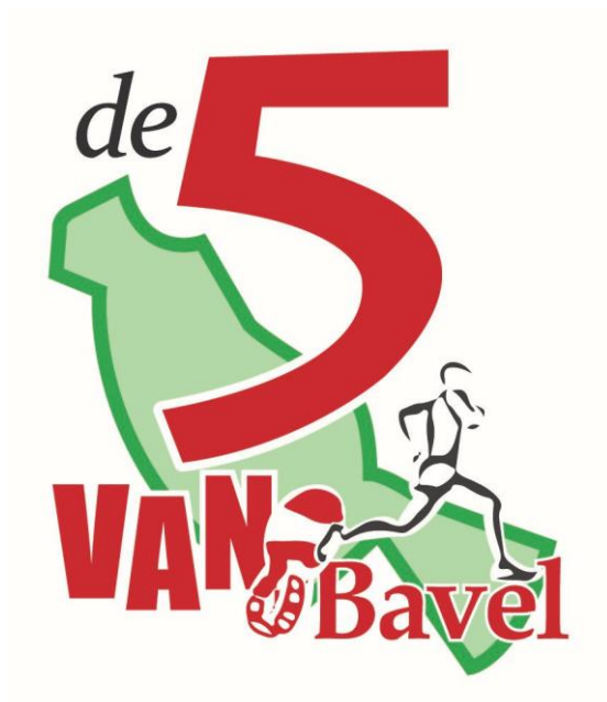
Logo De 5 van Bavel